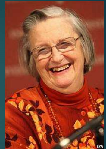
Elinor Ostrom Premio Nobel de Economía 2009

Recursos de uso común regionales/globales amenazas al sistema socio-ecológico