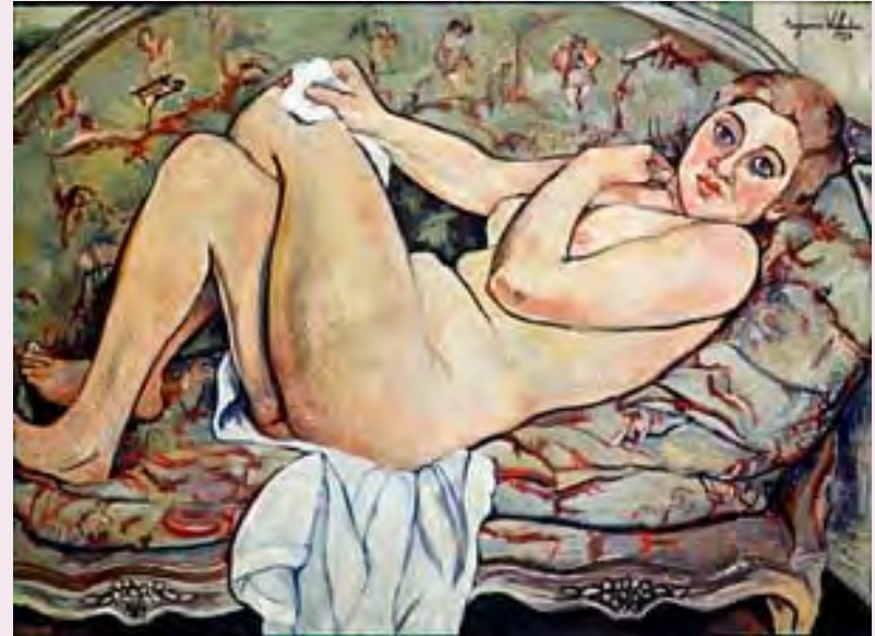
Desnudo reclinado por Suzanne Valadon