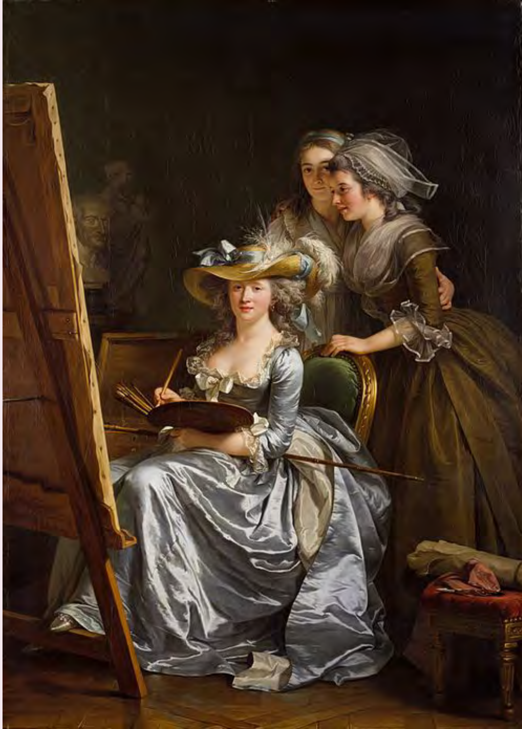
Adélaïde Labille Guiard (1749- 1803), Autorretrato con dos alumnas (1783)