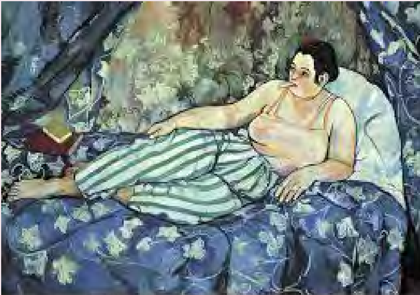
Portrait of Suzanne Valadon by Suzanne Valadon (1902). Oil on canvas, 104 x 111 cm. Collection Centre Pompidou, Paris. Musée National d'Art Moderne, Centre Georges Pompidou, Paris. https://www.musee-louvre.fr/en/visites-ouvertures/musee-louvre-ouvert