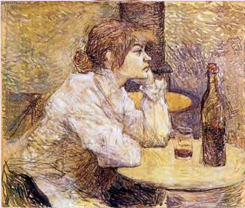
La Buveuse – Retrato Suzanne Valadon por Henri de Toulouse-Lautrec