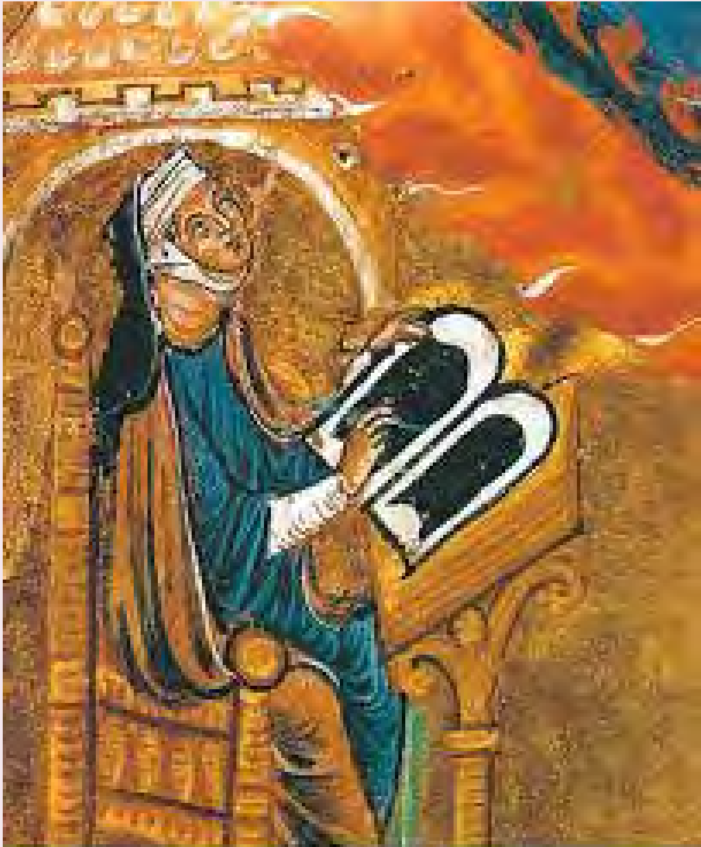
Hildegarda de Bingen (siglo XII)