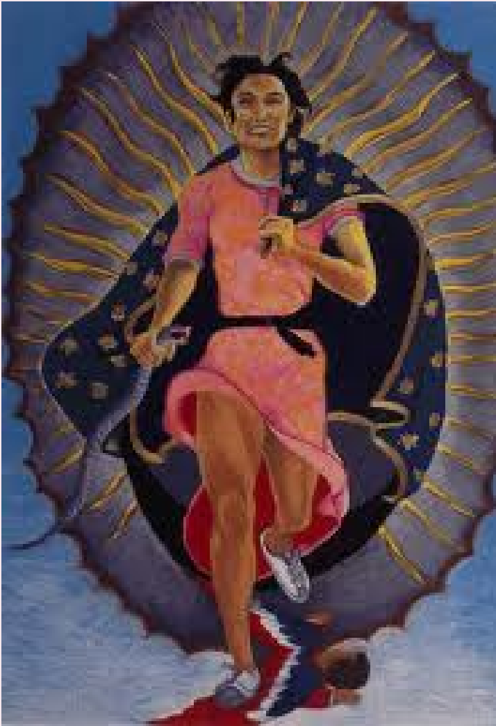
Yolanda M. López, “Retrato de la artista como la Virgen de Guadalupe” (1942)