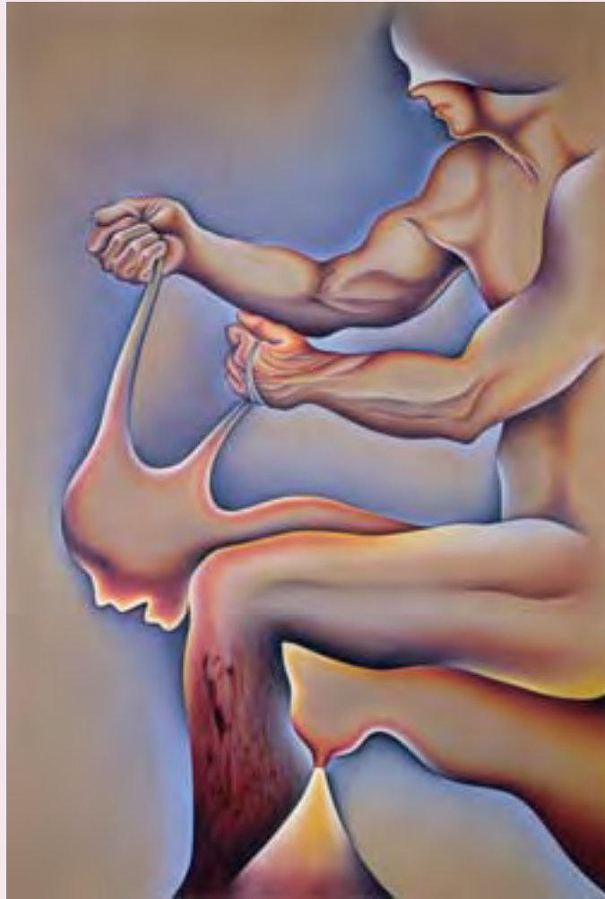
Judy Chicago, "Crippled by the need to control" (1983)